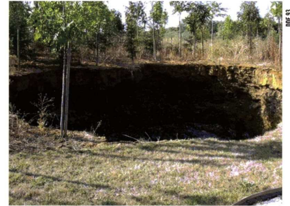
Affaissement dans un parc public (Seine-Saint-Denis)