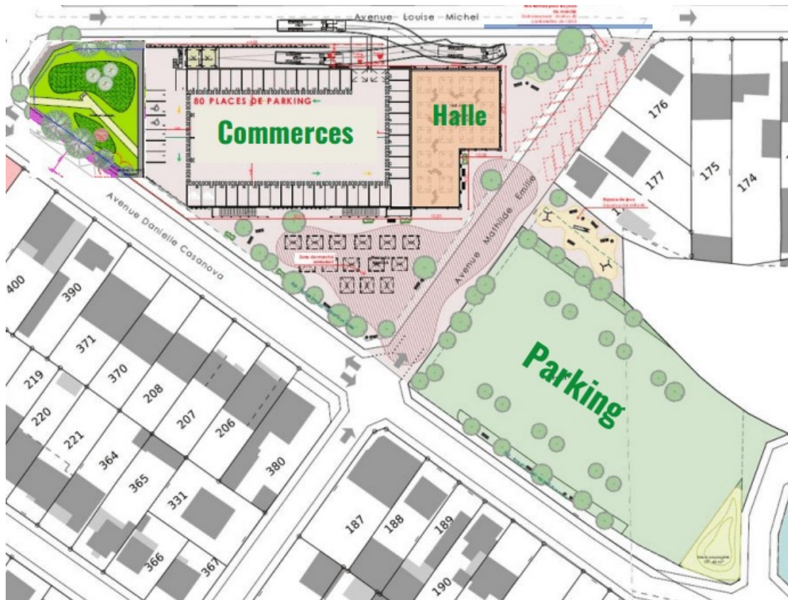
Plan synthèse du réaménagement du quartier Casanova